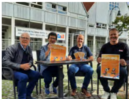
Fidolino – die Kinderkonzerte werden weiter gefördert