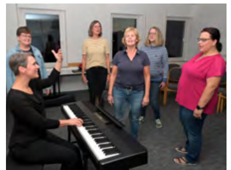
The Voice Company bei der Sologesang-Prob