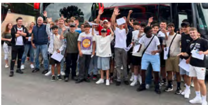
Der VFL Rheda fuhr zum Länderspiel nach Gelsenkirchen