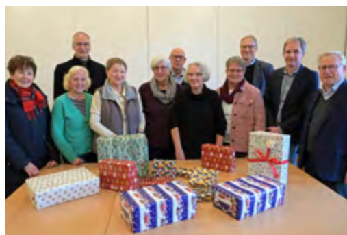
Die Weihnachtsaktion mit der Gütersloher Tafel

» Freiwillig engagierte Menschen in Rheda-Wiedenbrück unterstützt die Bürgerstiftung sehr gern, wie beispielsweise die Vesperkirche in der Piuskirche, den Ehrenamtstag und die Boule-Freunde Rheda.