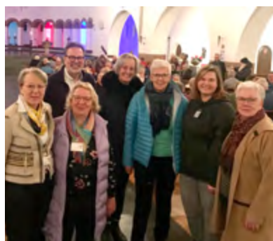
Der SKFM organisierte die Vesperkirche mit der Gemeinde St. Pius