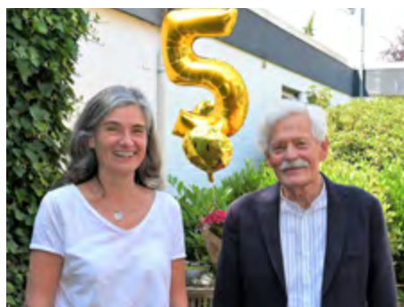
Seit 5 Jahren helfen die Soulbuddies

» Was gibt es für Angebote für junge Menschen und für Familien in Rheda-Wiedenbrück? Aktuelle und verständliche Informationen stellt das Chancenportal seit 2019 bereit. Rund 92.000 Mal wurde 2023 im Chancenportal recherchiert, Tendenz steigend. Seit letztem Jahr können die Angebote im Chancenportal in 133 Sprachen übersetzt werden. Durch diese neue Möglichkeit wird das Portal für alle jungen Menschen und Familien noch leichter nutzbar.